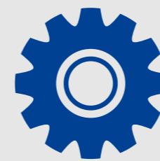
エンジニアリング事業